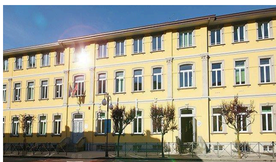
SAN PELLEGRINO TERME